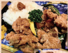
若鶏の唐揚げ弁当 500円 大盛 650円

昨年は多くの方々に助けて頂き、心より感謝いたします。 こうじん中山店では現在ランチ営業に代わり、お昼の11時から13時くらいまで500円(税込)でお弁当を販売しております。1個～100個まで受付けます。場所や個数に応じて配達もいたしますのでお気軽にお問い合わせください。手作りにこだわった完全オリジナルレシピの唐揚げとチキン南蛮をどうぞご賞味くださいませ！ ※詳しくはインスタグラムやホットペッパーをご覧ください。